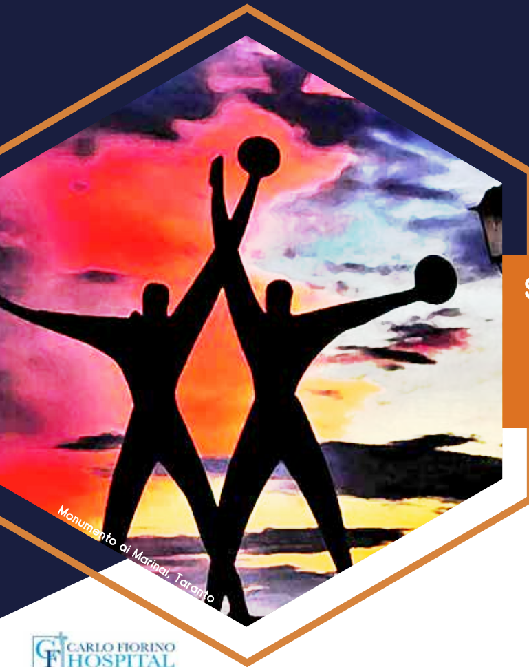
Monumento ai Marinali, Taranto